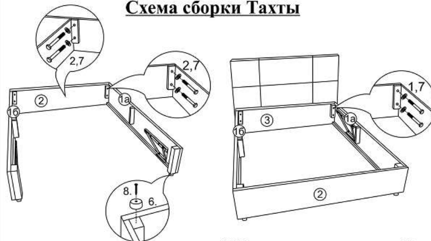
Схема сборки Тахты

1. Перед сборкой каркаса установить ножки (поз.6) на место и закрепить саморезами 5х35 (поз.8).